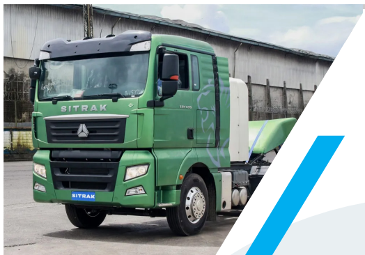
VOLQUETA 6 X 4 SITRAK C7H