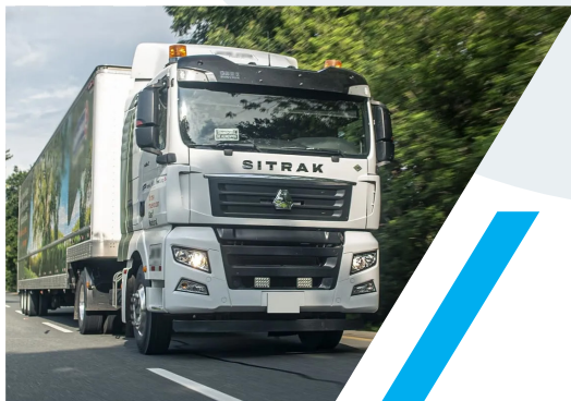
TRACTOCAMION SITRAK 4 X 2