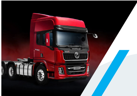
TRACTOCAMION SHACMAN X 5000

A continuación les ilustraremos algunas de las líneas de vehículos y repuestos de los cuales tendremos gran stock de repuestos.