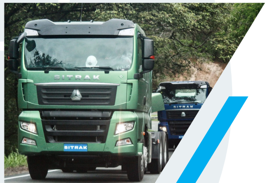
TRACTOCAMION SITRAK 6 X 4