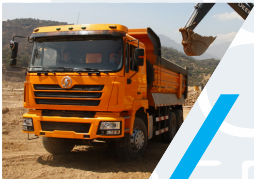
VOLQUETA 6X4 SHACMAN M3000/ X 3000/ X5000