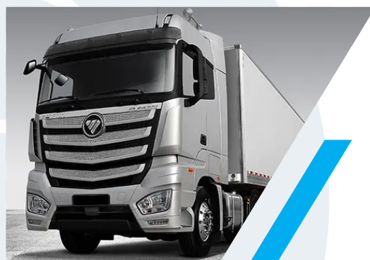
TRACTOCAMION FOTON 6 X 4