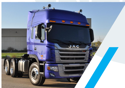
TRACTOCAMION JAC 6 X 4