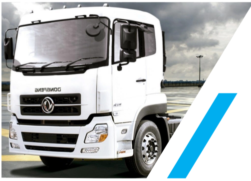
TRACTOCAMION DONGFENG 6X4