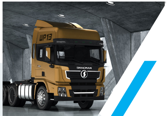
TRACTOCAMION SHACMAN X 3000