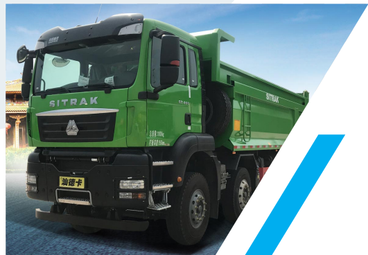
VOLQUETA 8 X 4 SITRAK C7H