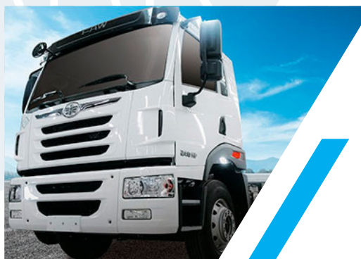
TRACTOCAMION FAW 6 X 4