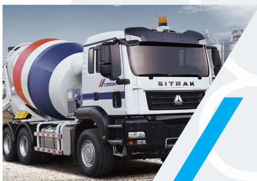
MIXER 6 X 4 SITRAK C7H