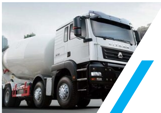
MIXER 8 X 4 SITRAK C7H